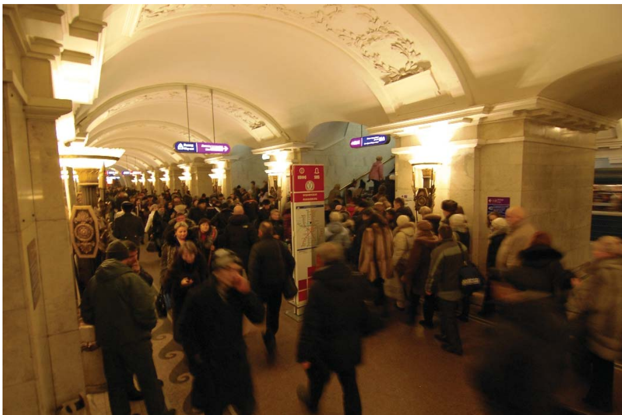
«Пушкинская» — центральный зал

На информационные столбы метрополитена это правило, к сожалению, не распространяется.