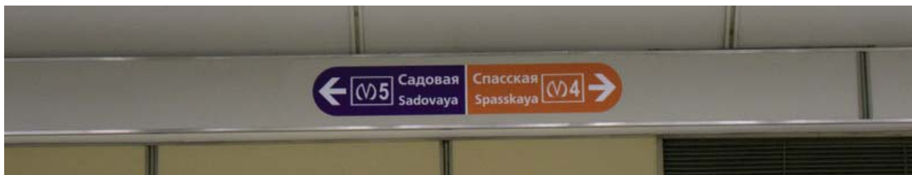
Переход между станциями «Спасская» и «Садовая»

Это специально для тех кто шёл шёл по коридору, остановился по середине по вертелся на одном месте и забыл откуда шёл.