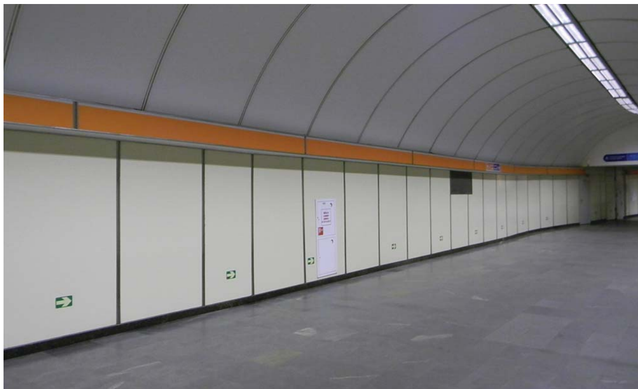
Переход между станциями «Спасская» и «Садовая»