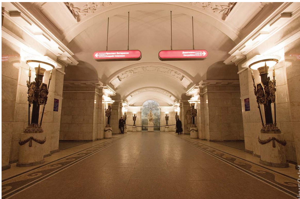
«Пушкинская» — центральный зал