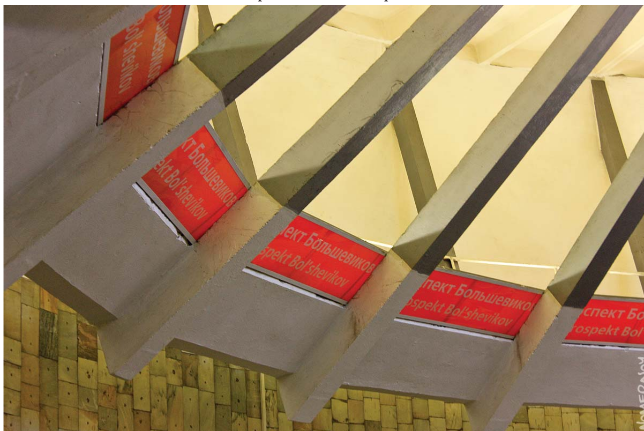
«Проспект Большевиков» — вестибюль