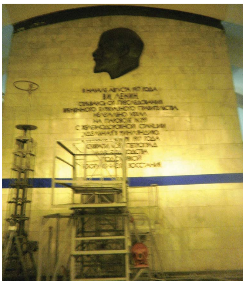
«Удельная» — торцевая стена