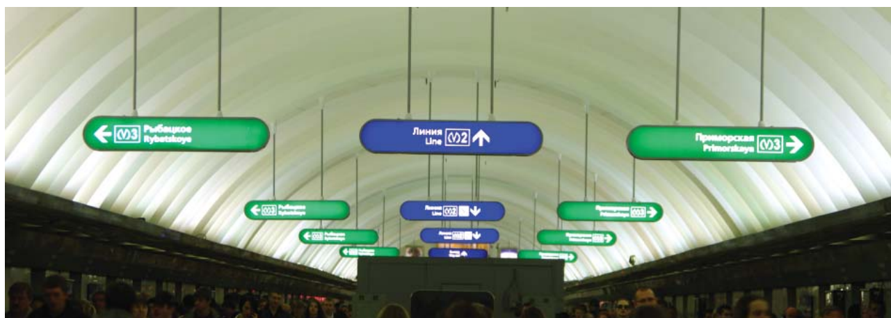
«Гостиный двор» — центральный зал