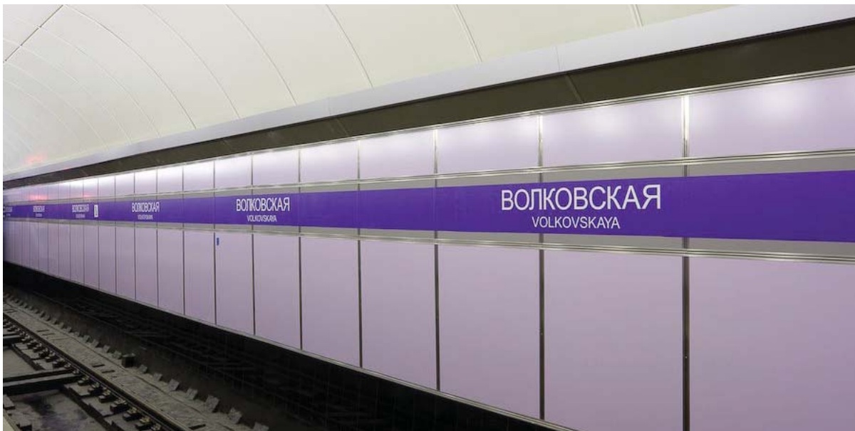
«Волковская» — путевая стена

Главная фишка НИПа, повторять название станции на стене как можно чаще