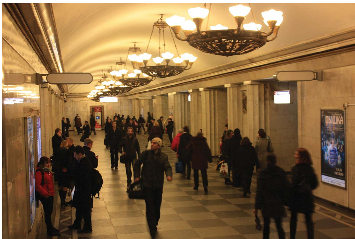
«Владимирская» — центральный зал