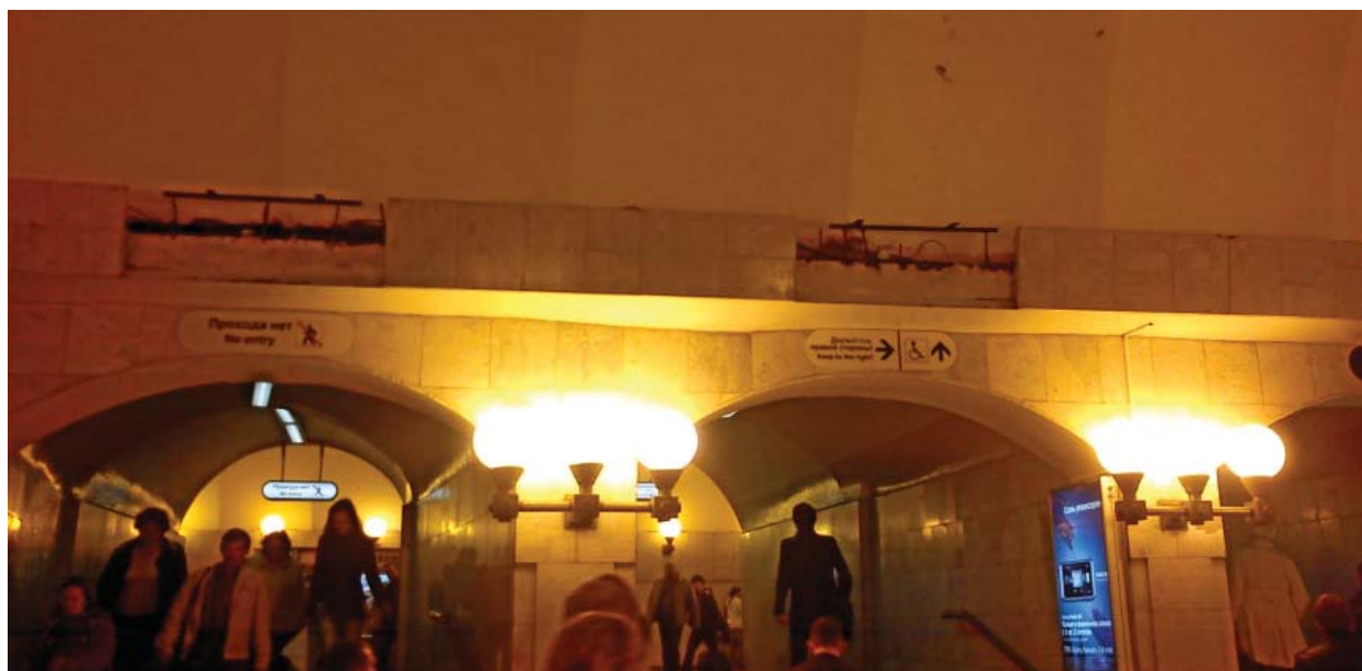
«Проспект Просвещения» — выход в город

И старые указатели тоже. Нечем дыру заделать? Ничего страшного, так оставте, метро ведь не для красоты, а для поездки