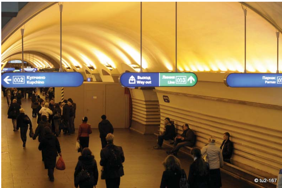
«Невский проспект» — вид со стороны входа с Михайловской улицы