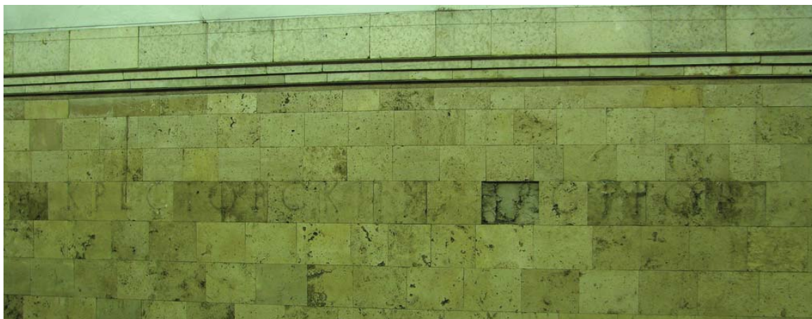
«Крестовский остров» — путевая стена

Старые буквы при этом можно сбить, чтобы не мешались