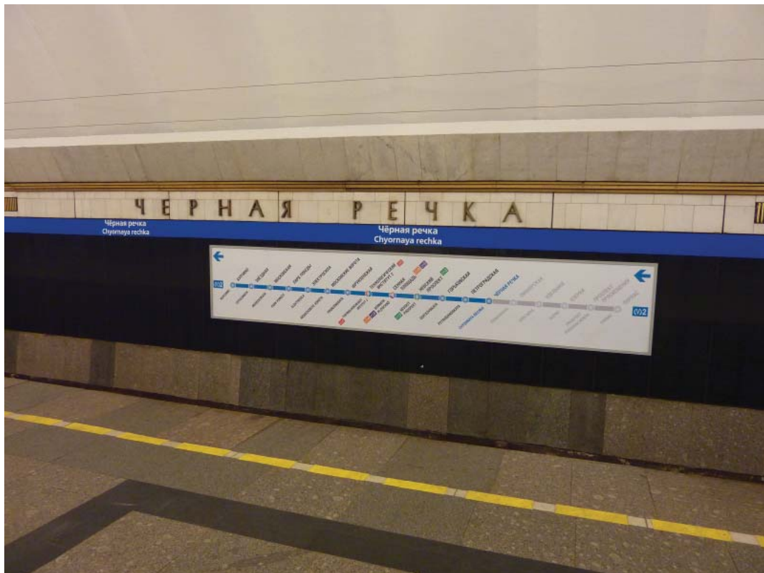
«Чёрная речка» — путевая стена