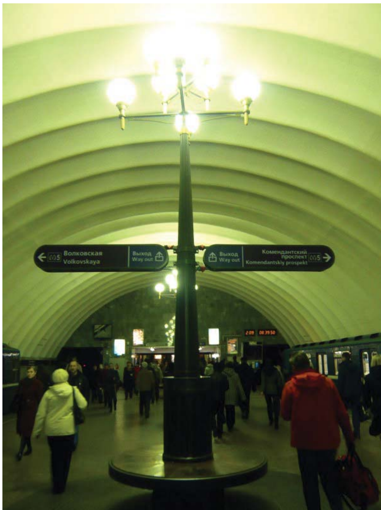
«Старая Деревня» — центральный зал

Зачем фонарь просто так стоит, надо на него указатели повесить, пусть полезную функцию выполняет