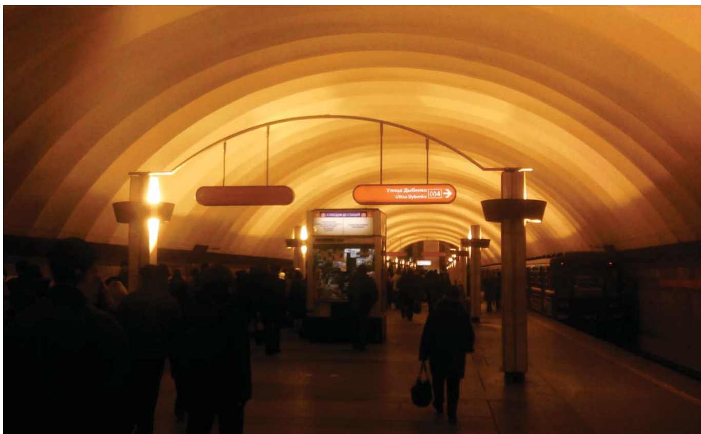
«Ладожская» — центральный зал

Не важно, новые указатели по другому не расположить