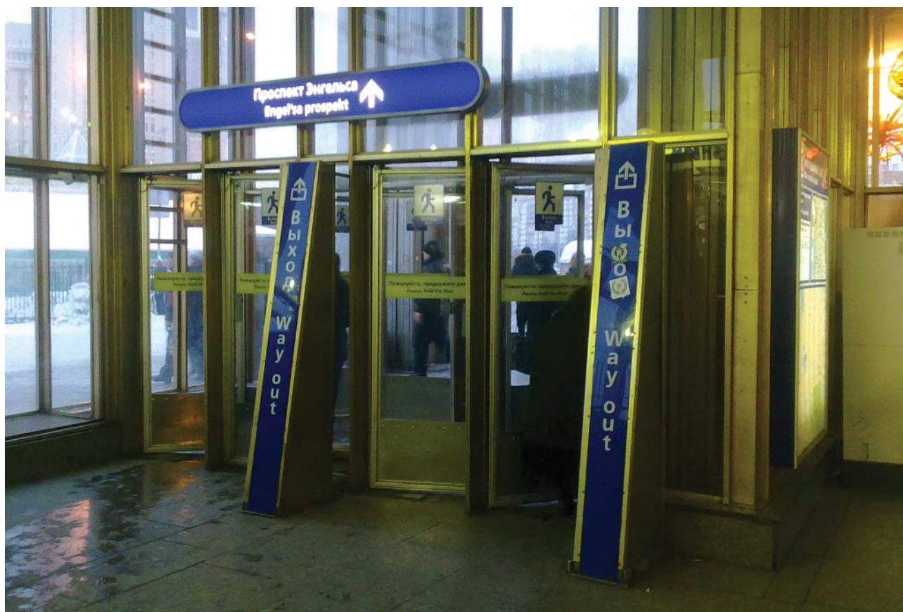
«Озерки» — выход в город

Самое главное занять всю имеющуюся площадь, надо и не надо